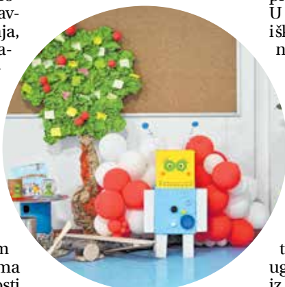
Kreativan i ugodan ambijent potiče volju za učenjem

u čitavoj Hrvatskoj. Učenike je za matematičko natjecanje pripremala profesorica Sanja Grgas. U kontekstu matematičko-logičkih kompetencija valja dodati i da se novljanska škola ove godine prvi put uključila u natjecanje u rješavanju sudoku zadataka. Sudoku natjecanje organizirala je Hrvatska Mensa uz podršku Agencije za odgoj i obrazovanje. Natjecanje se