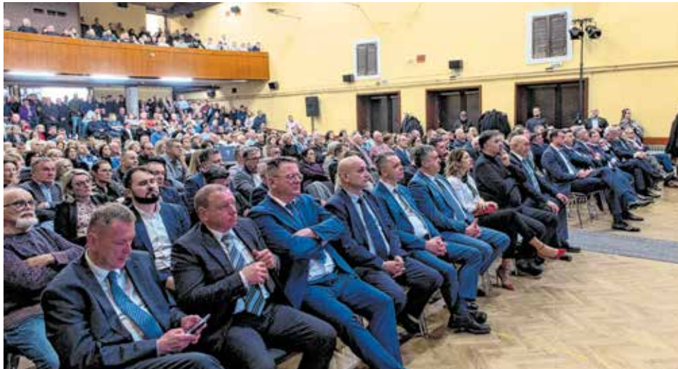
U Domu kulture u Novom Vinodolskom tražilo se mjesto više