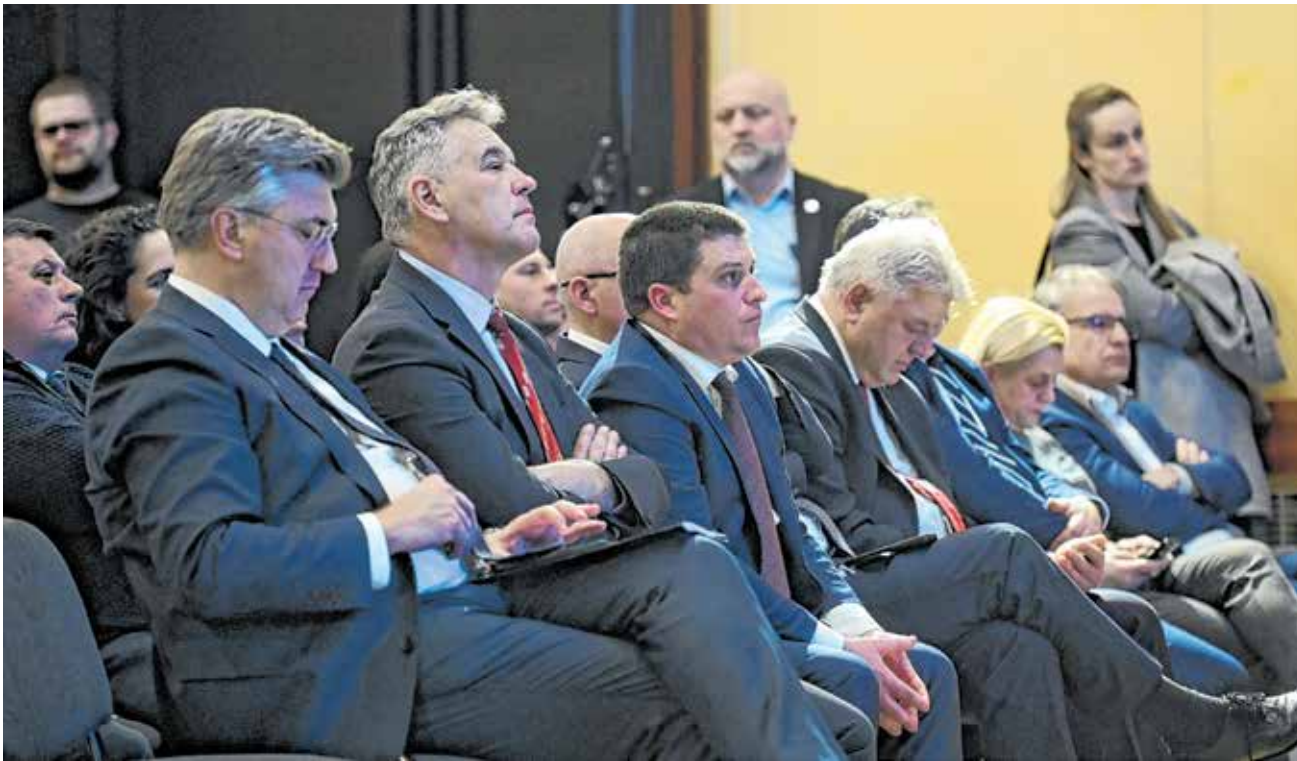
Svečanoj sjednici nazočio je i premijer Andrej Plenković sa suradnicima